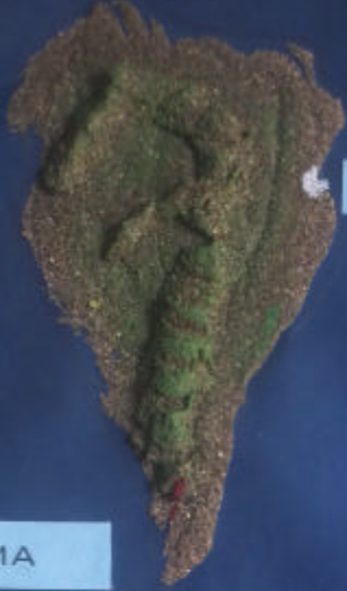
Santa Cruz de La Palma