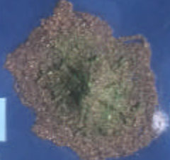
San Sebastián de La Gomera

Clima: húmedo, con la Caldera de Taburiente que capta mucha humedad en forma de lluvia. Vegetación: tipos litoral, bosque termófilo, laurisilva, pinar y cumbre. Tabaibas, cardones, palmeras, dragos, acebuches, rejalgaderas, sabinas, viñátigos, tilos, acebiños, jaras, pinos, codesos, escobones, tajinastes, retamas